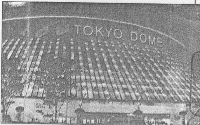
↑日本東京巨蛋是科技與智慧的結晶。