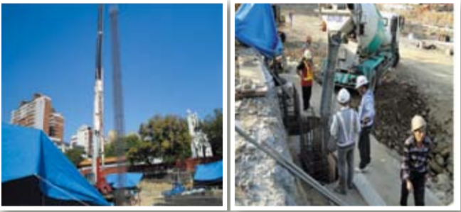
本校教學大樓新建工程經行政院核定工程總經費為5億8,600萬元(教育部補助80%為4億6,880萬元，本校自籌20%為1億1,720萬元)，99年5月12日開標結果，由茂新營造工程股份有限公司以總價新臺幣4億6,800萬元得標，並自同(99)年7月4日起正式開工，預計101年12月完工驗收，目前進行擋土柱灌漿作業中。