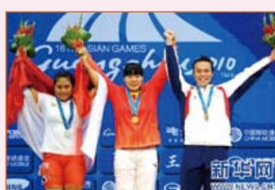
本校王雅珍同學(右一)榮獲2010年廣州亞運會女子舉重69公斤級銅牌。