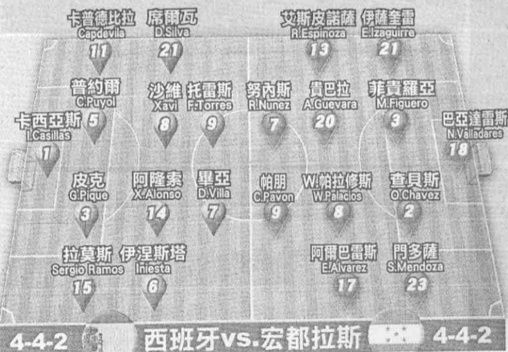
4-4-2 西班牙vs.宏都拉斯 4-4-2