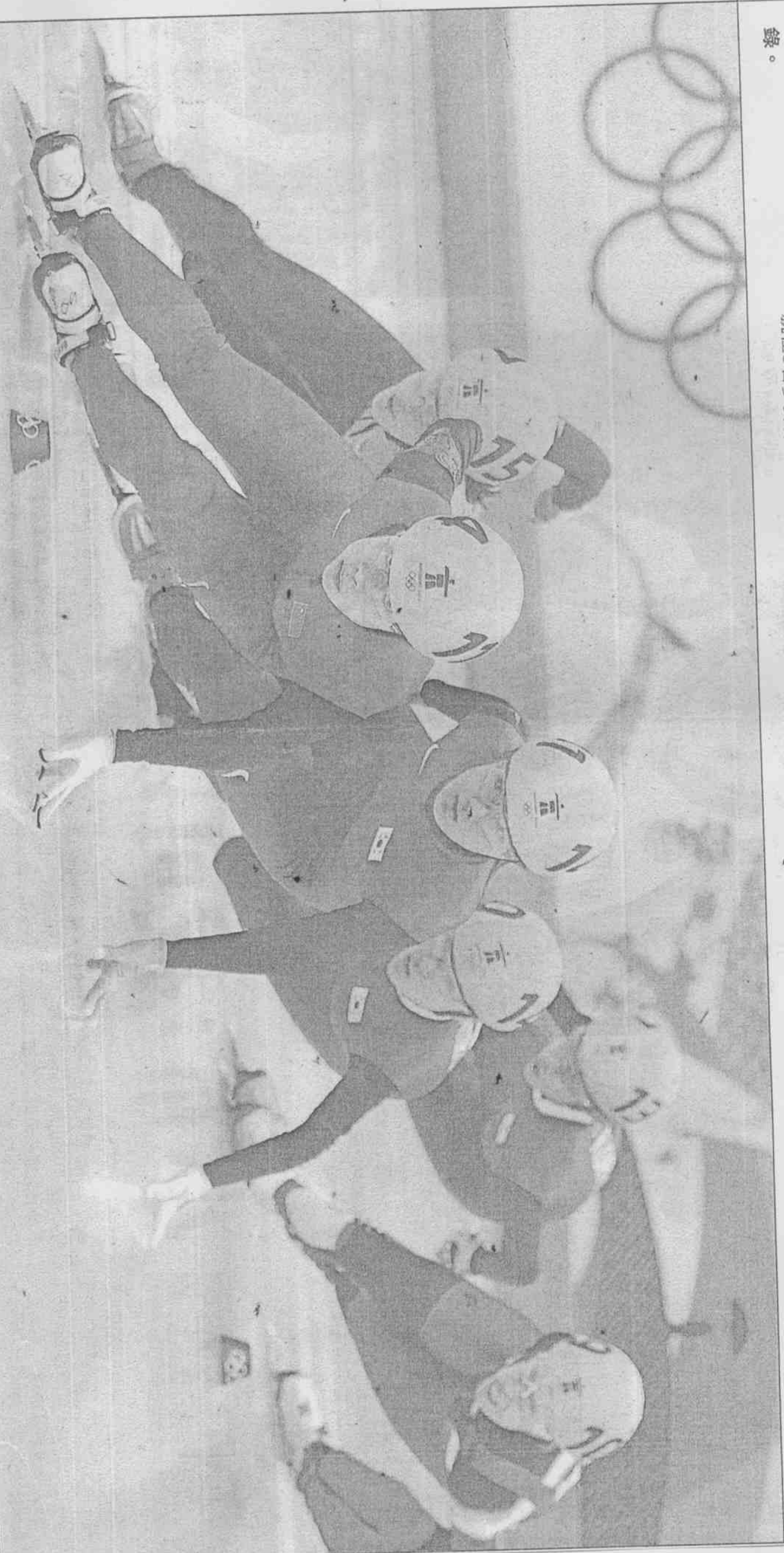
冬奧短道競速滑冰女子1500公尺決賽，中國的周洋帶領向前，南韓兩名選手在後伺機而動，周洋最後摘金。

荷蘭隊的圖伊特扮演程咬金，在男子1500公尺短道競速滑冰硬是比下奪金呼聲最高的美國選手戴維斯，為荷蘭隊搶下本屆冬奧第二金。戴維斯是這項目的世界紀錄保持人，創下1分41秒04的成績，但昨天的圖伊特則以1分45秒57奪下金牌，讓戴維斯飲恨溫哥華。