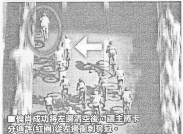
■倫肖成功將左邊清空後，讓主將卡分迪許(紅圈)從左邊衝刺奪冠。