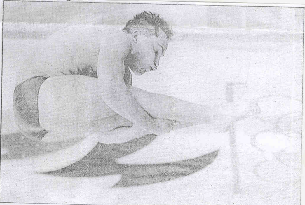
上屆奧運男子跳板金牌得主，美國隊 二十八歲老將蓋茲十七日加緊練習。 男子跳板將在八月一日 決賽。