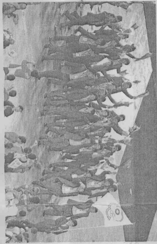
台灣隊進場 昨晚舉行開幕典禮，規模最盛大，代表隊名稱為「中華台北」，會旗是梅花旗。這何謂奧運模式？就是中國體育總局前一再強調的「委曲求全」，只會讓對手停全，自己國家委屈。 這說明，國家的空間是智慧與毅力爭取的，迷信謝長廷與陳菊兩任市長一以貫之的接力賽做得漂亮，最後馬英九才得以地主元首身分宣布世運開始已經超越體育，之前鏖而不捨的努力，據理力爭的交心，自發自覺中華民族不是別人，竟是政府自己。 為了避陳雲林來台，更激烈的奪旗毀掉畫面仇日黨，如此場景國人記憶猶新，七年後，馬英九成了總統察折斷旗桿。 「也希望大家配合」。有民眾帶旗子進場，當場遭警帶國旗進場，市長馬英九公開表示，「身為主辦城市，台北必須遵守國際規範，才能繼續舉辦國際賽事，也希望大家配合」。有民眾帶旗子進場，當場遭警

【記者許明達／高雄報導】昨天世運開幕典禮，會場內出現國旗、台灣旗等各式各樣旗幟，世運會比賽時，究竟能否攜帶旗幟進場？從世運門票背面的注意事項，未註明不得攜帶任何旗幟進場來看，答案是肯定的。 過去大型國際綜合運動賽會，主辦國在中國壓力下，不願意麻煩上身，在門票背面都有禁止觀眾攜帶參賽國旗以外旗幟入場的規定，一九九六年亞特蘭大奧運、二〇〇〇年雪梨奧運均如此。 去年北京奧運門票背面也印有「請不要攜帶非參賽國或地區旗幟」等語，甚至還禁止攜帶長度超過兩公尺、寬度超過一公尺的旗幟。 一九九六年亞特蘭大奧運，一名留美學生在觀眾席揮舞國旗，組委會以違反門票背面所書「觀眾不得攜帶各參賽國國旗以外旗幟進入奧運會場」，將該名學生請出場。