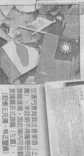
世運門票背面注意事項(上圖)，未註明不得攜帶任何旗幟進場，因此場內可見觀眾揮舞各式旗幟(左圖)。

次主辦國際性大型綜合運動會，世界要透過什麼管道看見台灣？不正是來台灣採訪的兩百多名外國媒體記者，當他們要拍攝開幕典禮畫面時，卻要由「大會提供」，這比外國媒體工作人員只能搖搖頭說：「Give us a try」，全世界沒有任何一個國家主辦運動會，因「維安」理由訂定這種規矩，我們要讓世界看見台灣，實際上讓人看到什麼？ （記者王元鴻）