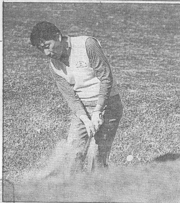
淡水高球賽 首日成績表(36洞)