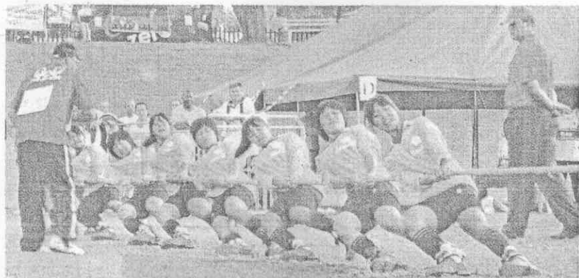
台灣女子拔河隊昨在世界室外拔河錦標賽勇奪500公斤級金牌。