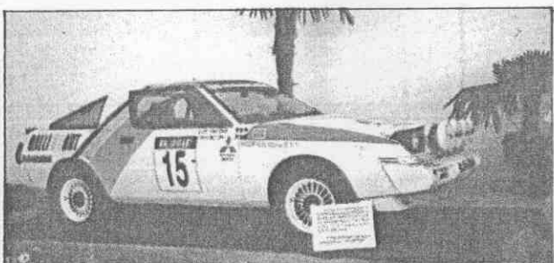
← 贏得賽車冠軍的座車。