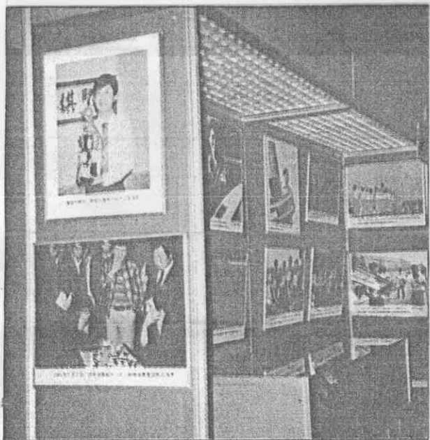
↑ 博物館內陳列的照片與實物。

這個博物館配合亞運，於8月間才竣工，因此陳列的內容還不盡完整，也太靜態了些，但畢竟這是全世界唯一以中國體育為主題的博物館，仍然很值得一觀。