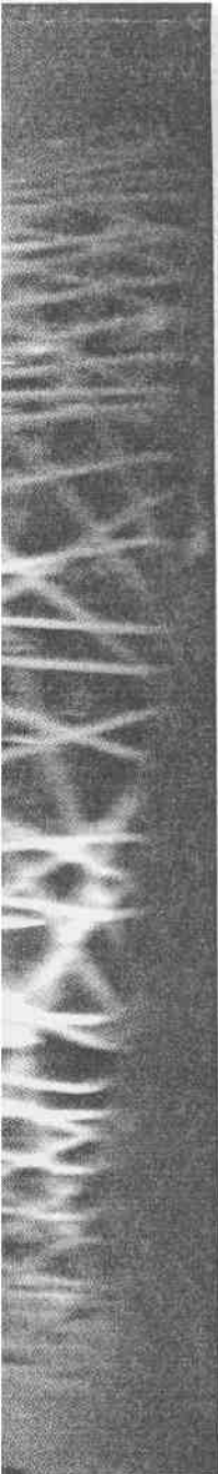
▲北京奧運會主體育場「鳥巢」1日晚間燈火明亮。前一天，「鳥巢」兩個總配電室才接通了由鄰近變電站所供給的第一路電源，正式通電。

大陸學者估計，全球黑嘴端鳳頭燕鷗的數目已少於五十隻，上述地區與台灣馬祖是少數仍可「幸運」看到「神話之鳥」（黑嘴端鳳頭燕鷗別名）的地方。