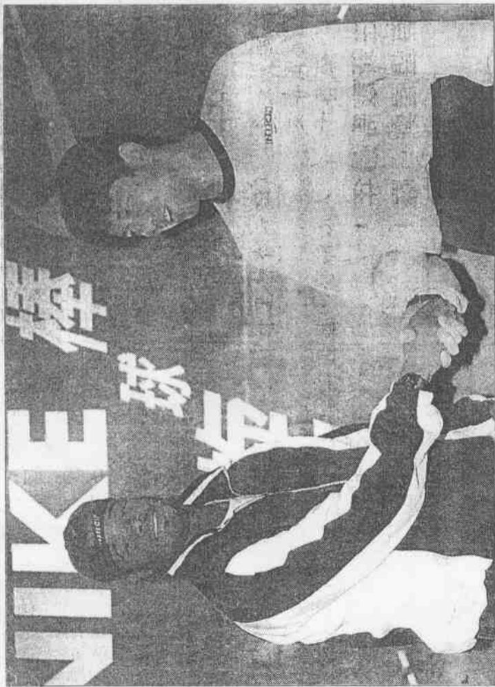
台訪下排安商廠在也菲端葛小、(右)雄英茂野星明棒職國美、即掛業商運體

包括籃球、棒球、高爾夫、撞球、保齡球等運動，國內職業運動規模已越來越盛，不過今年出現包括那魯灣三、職棒大聯盟在內的許多大賽，體育界已幾乎完全被商業機制滲透，國內體育活動更見蓬勃。 職棒大聯盟是第一家由有線電視網主導推出的職業賽，籃球協會的超級聯賽也在外商公司主導下，將甲組業餘籃球賽「改制」為半職業賽，連教育部主辦的高中籃球聯賽，都成為美商之EBC主導的HBL。至於高爾夫、保齡球、撞球等協會的比賽，今年也完全淪陷為有線電視外製外包的「節目」；從有線電視紛紛包攬切劃國內職業、高中運動聯賽情形來看，令人憂心未來國內體育活動，勢將成為它的附屬品。