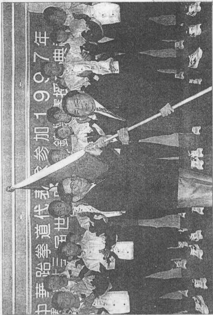
證保牌金的體壇國際國軍進國我是道拳跆

跆拳道在國內所有運動協會中，已打出獨一無二的「金字招牌」：中華跆拳道隊只要代表國家出征，必定攜回金牌交帳。連下屆奧運確定將跆拳道列入正式比賽後，國人已將中華民國贏得第一面奧運金牌的希望，完全寄託在跆拳道選手身上。