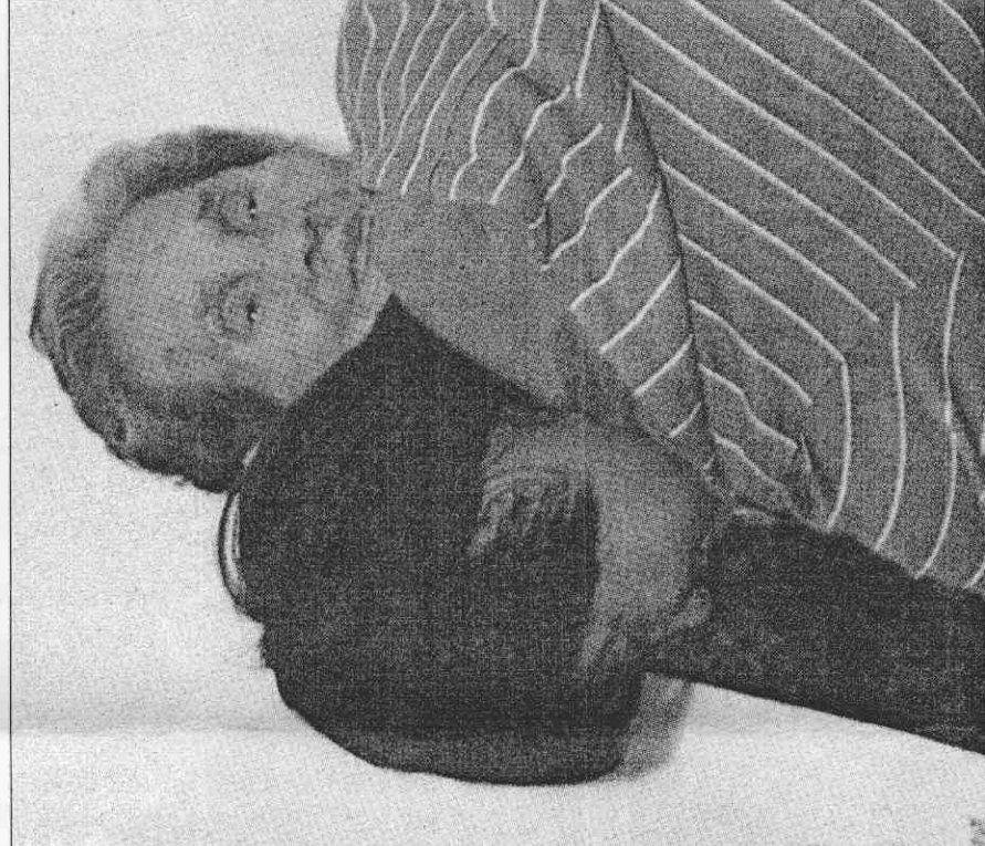
獲得LPGA錦標賽冠軍的曾雅妮（前）返台，擁抱前往接機的阿嬤。

「新天王」是她第二年鎖定的目標之一，還希望「博帶次數」能擠進年度統計榜內。她最想念的是士林夜市小吃，尤其是「烤醬油飯」，「本想從第一攤吃到最後一攤，結果拿了冠軍，恐怕行程滿檔。」預計在台停留到十日。 【記者范凌嘉／台北報導】馬英九總統昨天接見高爾夫錦標賽冠軍曾雅妮，肯定曾雅妮樂觀率真、努力不懈。馬總統鼓勵曾雅妮精進球技，希望體委會等相關單位給予最大協助，讓曾雅妮世界排名早日晉升世界第一。