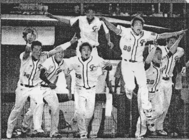
「八搶三」對澳洲隊勝利這一刻，「北京，我們來了」