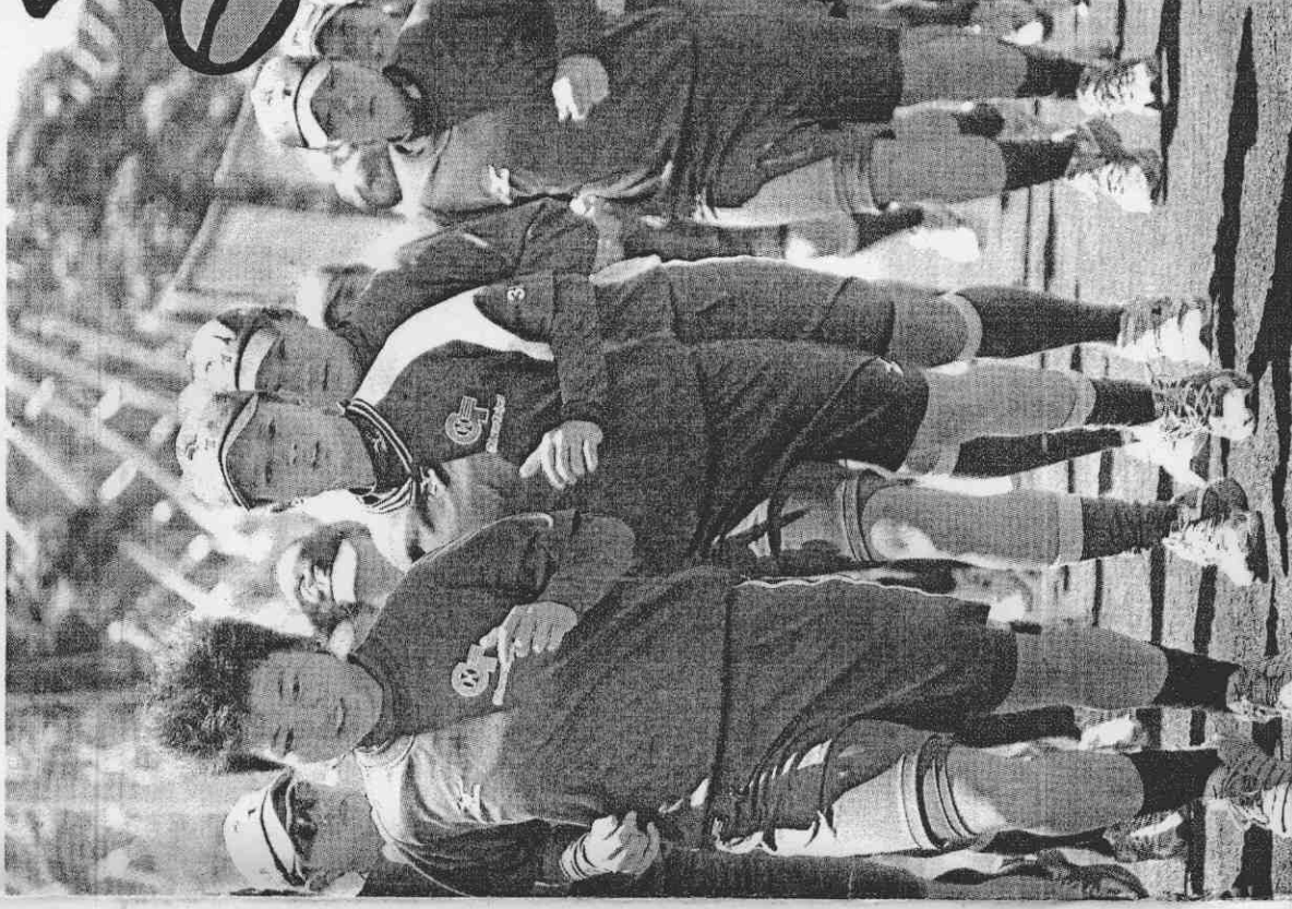
奧運女壘代表隊在烈日下加緊操兵。