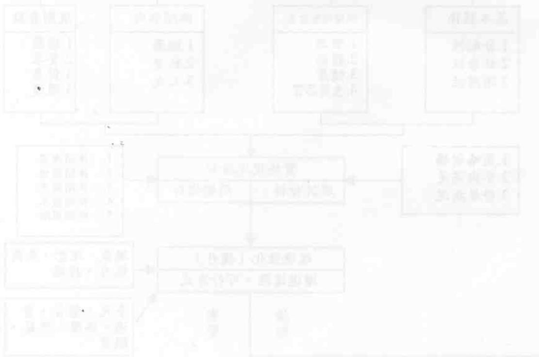
圖 1-1 生活品質與休閒活動的關係

(四)生活品質：生活品質 (quality of life) 簡稱「QL」，意指一個人在生活中，享有較高的生活環境 (安全、潔淨、福利、健康)，並且在心理層面上 (愛、自主、接受、尊敬) 受到一定程度的滿足和實踐的一種生活模式，我們就稱它為「生活品質」(陳鑑明，民 90 引用 McRae, 1994)。陳鑑明 (民 90) 歸納指出，生活品質指的是在人類生存的基本需求中，足以豐富生活的一切因素或條件，並且包含了健康的生活環境、健康的身體、以及良好的閒暇活動。所以，休閒活動的施行將有助於達到優質之生活品質的理想。