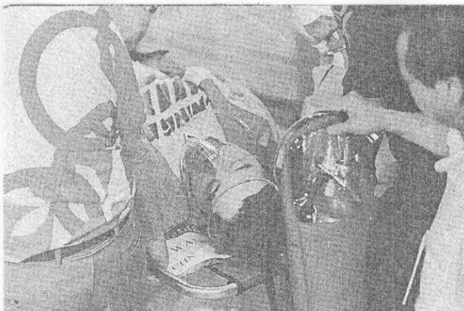
失金 失利 ●大陸射擊名將王義夫失利暈倒後，戴上氧氣面罩送醫。奧運採訪團記者 鍾豐榮／亞特蘭大傳真 ●中華射手杜台興，在十公尺空氣手槍預賽未能晉級。 奧運採訪團記者 鍾豐榮／亞特蘭大傳真