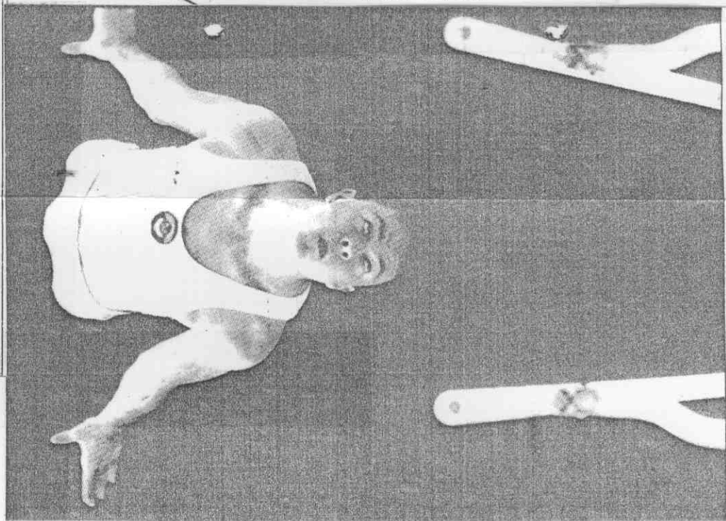
演表的確精、美優上槓雙在夫莫提與他使。作動。牌金項此了了。 (真傳社新法)