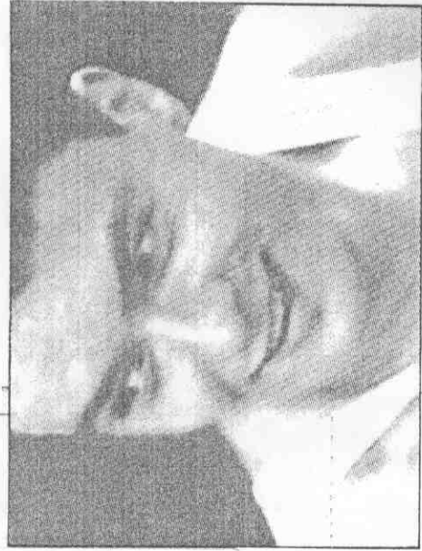
↑ 艾提莫夫，手選的牌金面四位勝出的利發得得樂莫夫(真傳城漢報本)。

【美聯社漢城二十四日電】蘇聯今天在男子體操個人單項決賽中，威風八面，在六個單項中有五項不是獨得就是與他人分享金牌。 全能金牌得主艾提莫夫，今天又添得雙槓、單槓兩面金牌，成為漢城奧運第一位四面金牌男選手，他在地板運動中也得了個銀牌。 二十四歲的大陸「跳馬王」樓雲，終於奪得跳馬金牌，替大陸隊在體操賽中挽回了一點顏面，這也是蘇聯隊今天唯一未獲獎牌的項目。 今天比賽中有好幾個獎牌是兩人平分秋色，甚至