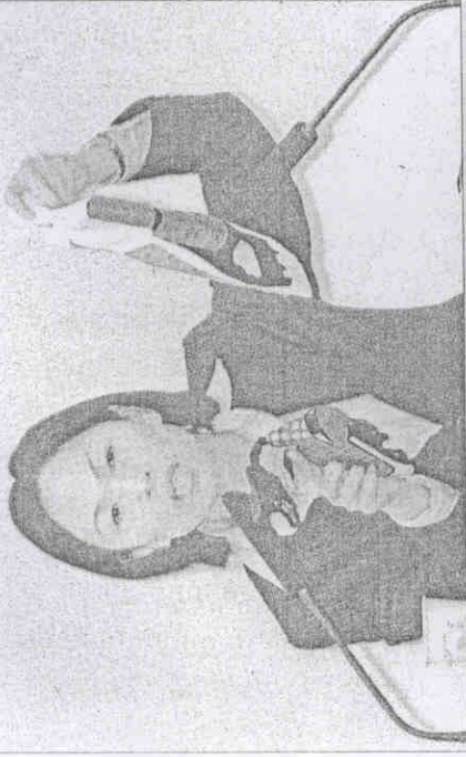
為「跆拳道」起頭而戰

「國際運動仲裁庭」須在「接獲不服判決21天內」處理 楊案昨剛好屆滿 我決先出手 明年3月底前可望塵埃落定