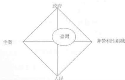
臺灣競技運動利害關係人(Stakeholders)發展象限圖