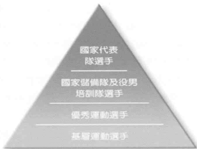
圖一、我國運動選手培訓分級制度圖

關於「我國運動選手四級培訓體系已建制完成，基層運動選手由各直轄市及縣市政府所屬各級學校負責培訓；優秀運動選手由大專體總、高中體總及單項協（總）會負責培訓；學校及社會甲組運動選手由大專院校、單項協會（總）負責培訓；至國家代表隊選手，則由本會國家運動選手訓練中心及單項協（總）會負責培訓。」（行政院體育委員會，2004；李高祥，2002）換言之，完整的金字塔型四級培訓體制（詳如圖一、表一），已成為政府規劃執行的方向（周國金、余宗龍，2003）。