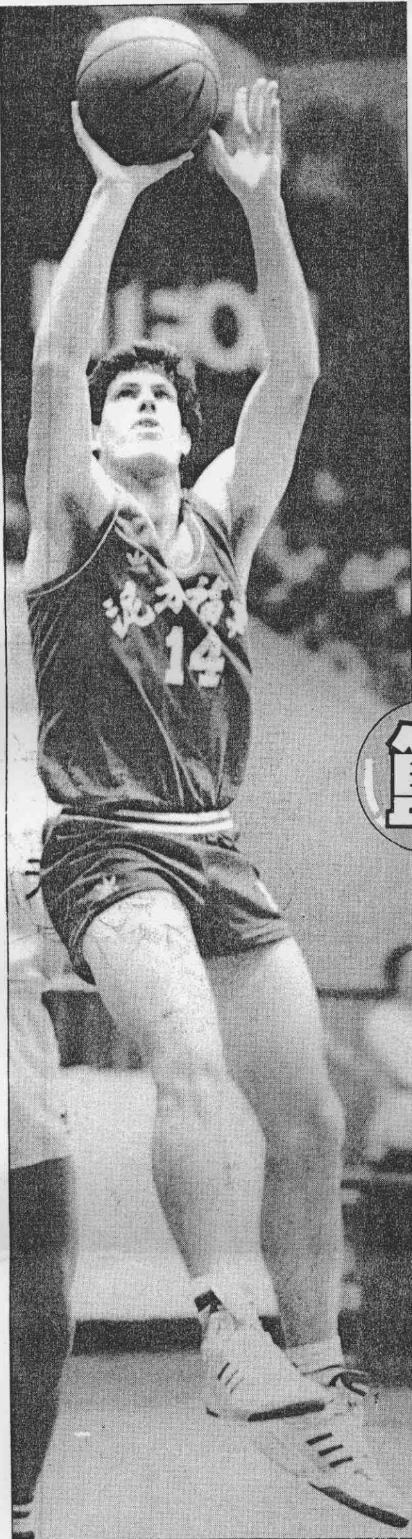
↑幸福水泥洋將麥克協調性極佳。