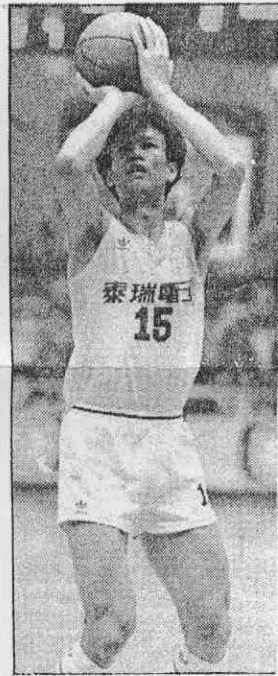
↑泰瑞曾增球長程火力驚人。