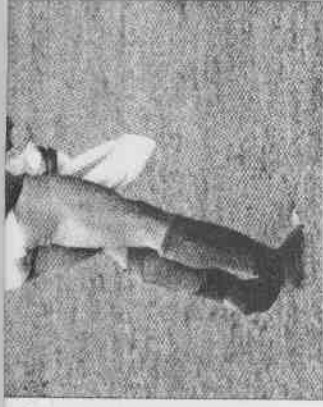
▲義大利加圖索擊敗法國後，順勢把褲子脫了慶祝。

至於史上最低的「金靴獎」得主產生於1938年、62年世足賽，都是4球。38年那屆年代已遺失，62年智利世足賽共有6人並列金靴獎。但從66年英格蘭世足賽起，想「金靴獎」至少要進6球（含）以上。沒想到相隔40年後，今年卻又出現不到6球的「金靴獎」得主克洛斯。