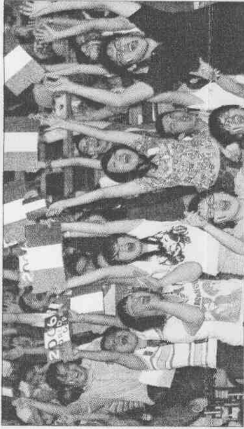
▲世足賽決賽戰當晚，熱情的球迷守在小巨蛋熬夜看轉播，在義大利隊獲得勝利的一刻支持者興奮的尖叫吶喊。

西班牙媒體報導，強化後防戰力是卡佩羅接掌皇家馬德里後的第一要務，卡納瓦羅和贊布羅塔這兩大鐵衛必然是皇馬隊最屬意的球星，據說，球會已開出年薪一千五百萬歐元的價碼，等