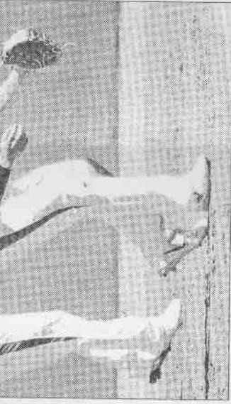
昨天積極投入教練春訓練習賽。