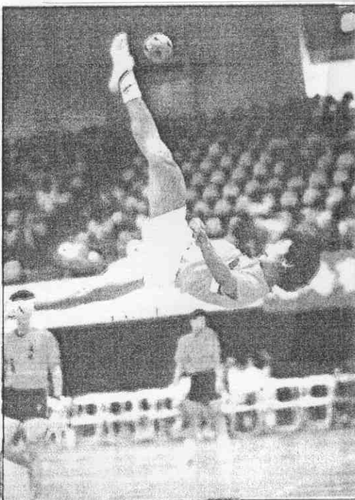
凌空倒掛以腳盤扣球，是藤球的高難度動作