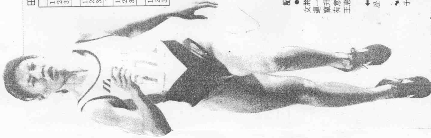
田徑二十四日決賽成績表