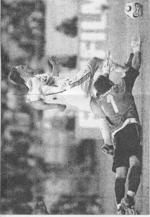
▲法國的里貝里（上），帶球過了西班牙球門的防守，卡西亞斯斯的防守，攻門得手。