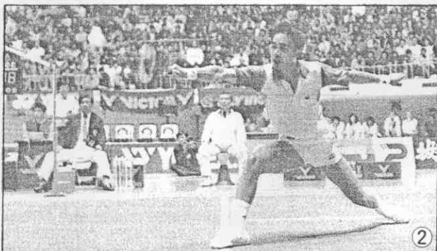
。手好的地等亞、歐自來敗擊後先，前面人國在羽施③②。軍冠軍女得贏琛拉后球麥丹①