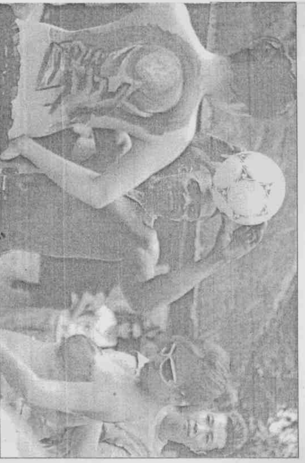
北京一處公園裡的大陸模特兒，展示人體彩繪的足球圖案，吸引大家能來大螢幕世足轉播。

巫師安東尼奧·瓦斯科斯從水晶球中發現，巴西將在今年冠軍賽中敗北，而且還是輸給未曾奪冠的荷蘭隊。若果真如此，上屆義大利隊