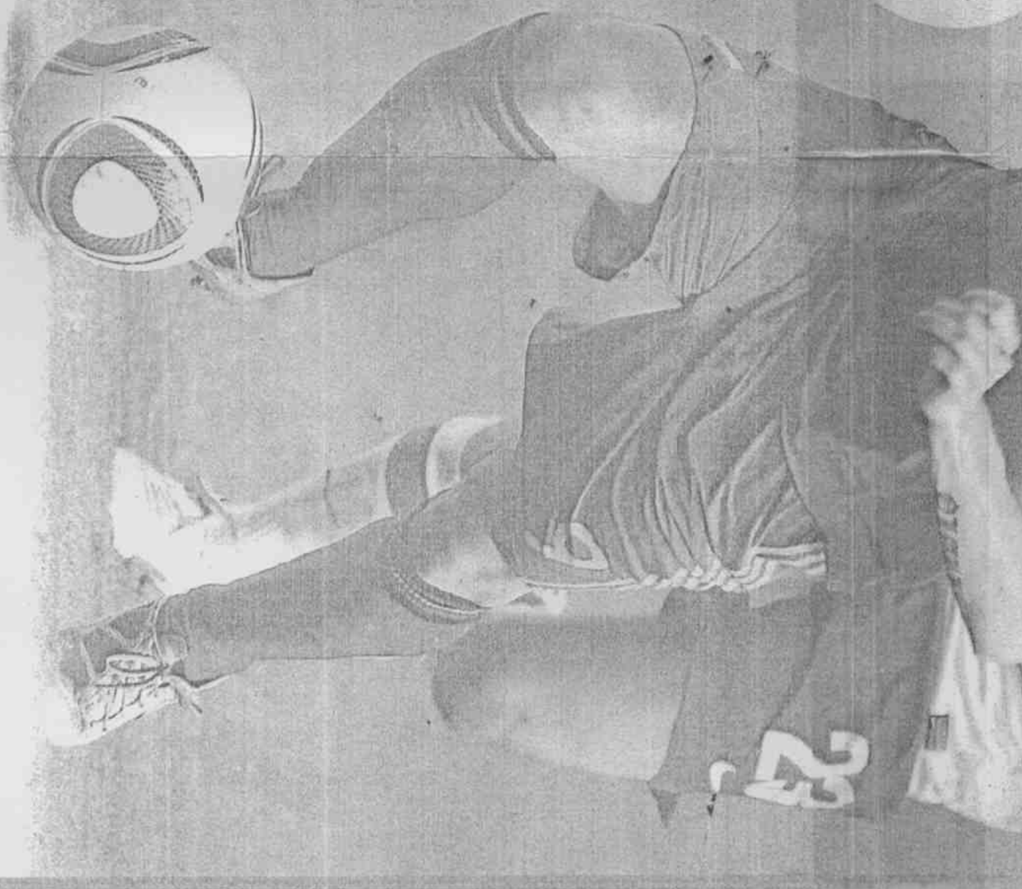
西班牙托雷斯（左）傷癒後迫不及待想上場試身手。

那場羅納度第1球令卡恩耿耿於懷，他說：「人都會犯錯，可是冠軍戰不應該發生失誤，這種失誤無法原諒自己。」（楊育欣）