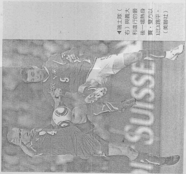
▲瑞士隊(右)與義大利進行的最後一場熱身賽，雙方以1比1踢平。

這個地方原本是橄欖球的訓練中心，居民並不熟悉足球，西班牙還特別對場地整修，由於外出不方便，在大本營裡特別安排了廚師料理食物。 即使位置偏遠，但西班牙球迷還是蜂擁而到，每次進球場看上一定是擠滿人，出入口一定會有人搖旗吶喊，卻不索取簽名，單純只是要讓球員知道球迷與他們同在。