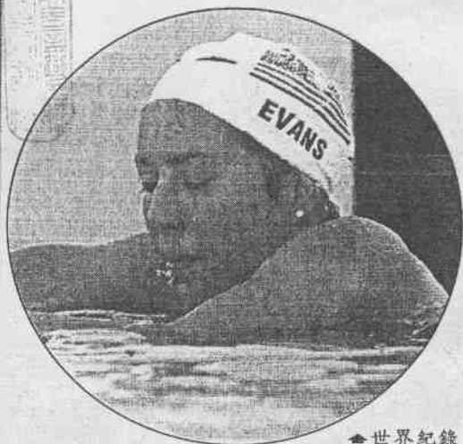
◆世界紀錄保持人美國女將伊文絲二十四日游完奧運女子八百公尺自由式預賽後，露出失望的表情。