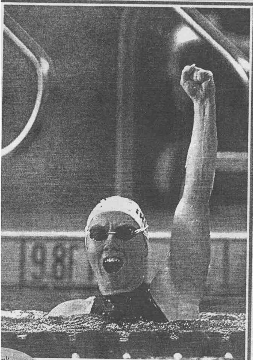
◆愛爾蘭女將史密絲贏得女子二百公尺個人混合四式冠軍，她高舉拳頭以示勝利。這是她本屆奧運第三面金牌。