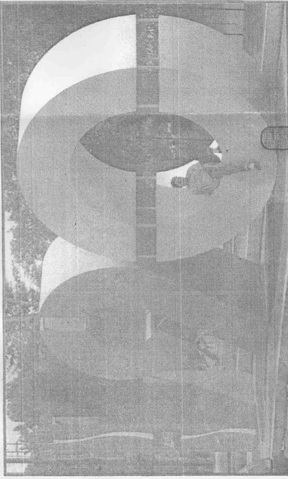
↑羅馬的6日天氣相當熱，不過這位仁兄顯然在羅馬奧林匹克運動場新聞中心附近，找到一個納涼好地點，坐在1990年世界杯巨型標誌的○字上。法新社/傳真

ama」最近刊出一篇長達9頁的文章「如何逃避世界杯」，這份手冊教導讀者如何避開長達1個月的比賽及12個主辦城市混亂的情況。電視及報紙已進入了最後讀秒階段，大炒特炒世界杯題材。紅、白、綠三色的積木型世界杯幸運物似乎在全