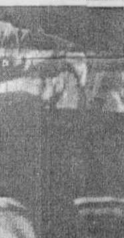
●五月廿一日龍、獅在高雄交手，雙方打成一場打擊混戰，賽時整創比賽時間最短的職棒新紀錄。