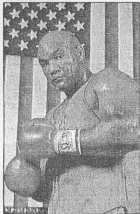
↑福爾曼不服老，仍然雄心勃勃，希望撂倒後生小輩泰森。