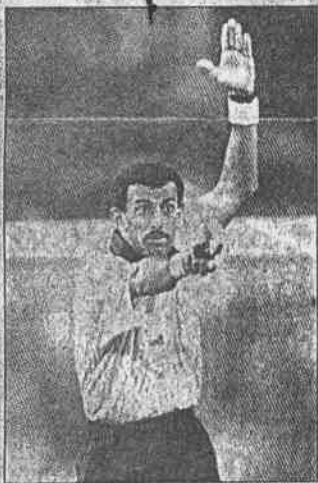
世足最近幾場比賽裁判很受議論，足總昨天公布兩場四強賽主審人選，巴西對荷蘭之戰由阿拉伯聯合大公國的布傑尚擔任。(法新社)