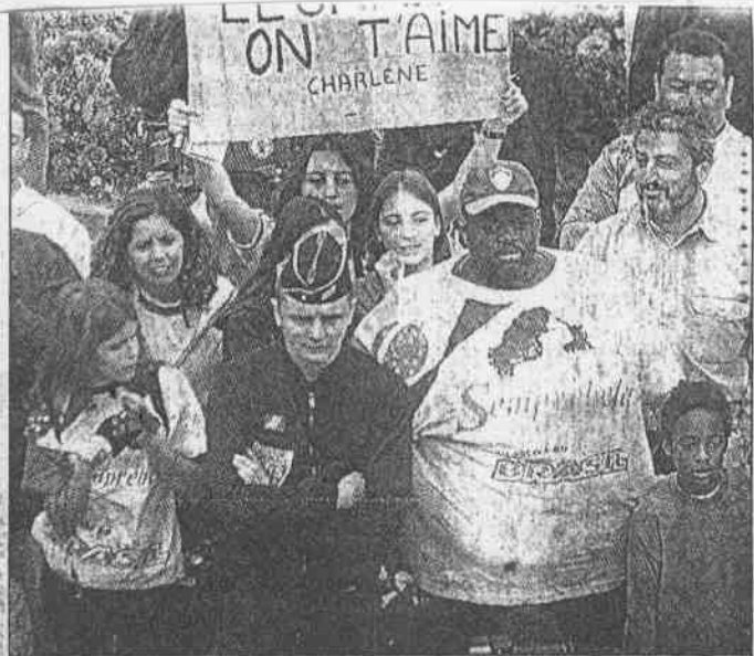
↑巴西隊球迷高舉「連納度我愛你」的標語，為該隊球星連納度加油、打氣。