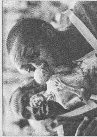
▲肯亞贏得街頭足球冠軍，高興極了。