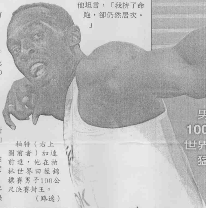
柏特（右上圖前者）加速前進，他在柏林世界田徑錦標賽男子100公尺決賽封王。