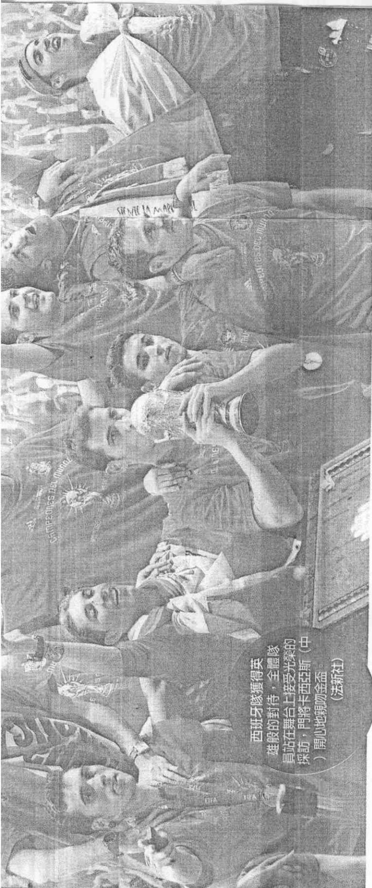
西班牙隊獲得英雄般的對待，全體隊員站在舞台上接受光榮的採訪，門將卡西亞斯（中間）開心地親吻金盃。 （法新社）