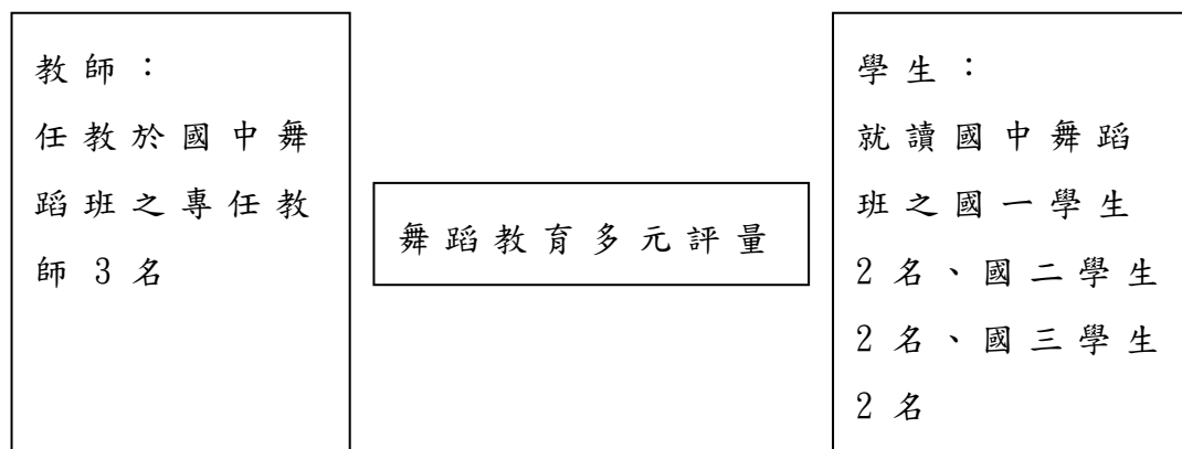
圖 4 研究對象

本研究以新竹市國中具舞蹈藝術才能班的國一 2 名學生、國二 2 名學生、國三 2 名學生以及舞蹈班教師為研究對象。教學評量除了給予學生實施評量之外，教師和學生也需要透過評量的結果來檢視教學活動的過程，以整體評估以獲有效結果。