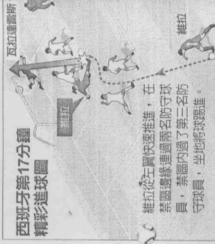
西班牙第17分鐘精彩進球圖

維拉從左翼快速推進，在禁區邊緣連過兩名防守球員，禁區內過了第三名防守球員，坐地將球踢進。