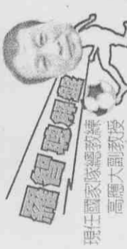
現任國家隊總教練高麗大副教授