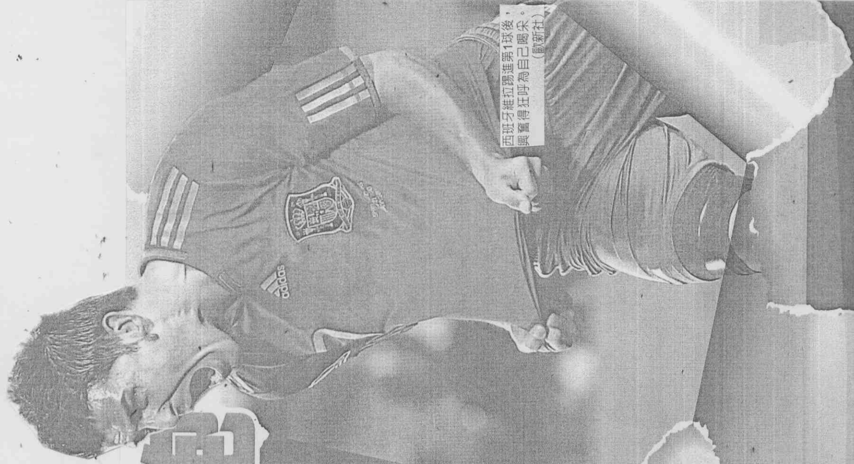
西班牙維拉踢進第1球後，興奮得狂呼為自己喝采。

維拉從左翼快速推進，在禁區邊緣連過兩名防守球員，禁區內過了第三名防守球員，坐地將球踢進。