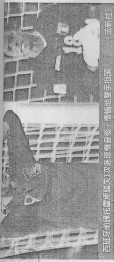
西班牙前鋒托雷斯錯失1次進球機會後，懊惱地雙手抱頭。

要。」托雷斯出賽70分鐘雖沒有表現，但受傷的膝蓋並沒有出現不適，他表示，很高興經過那麼久之後終於能夠上場70分鐘，如果教練希望的話，他甚至可踢滿全場，這是最重要的事。