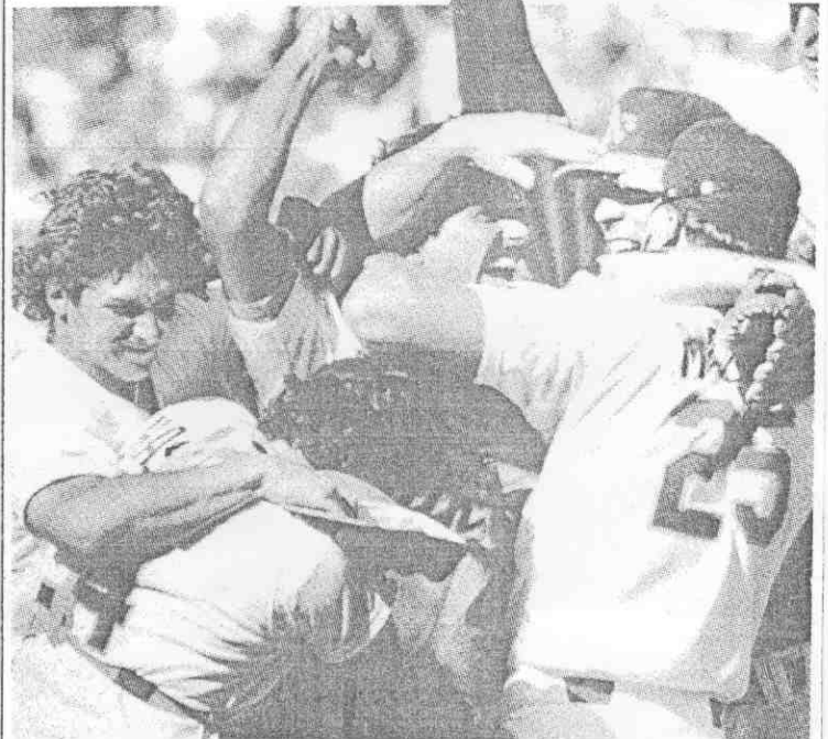
奧克蘭運動家隊球員在奪得美聯國美棒職隊冠軍後，相抱慶祝。

【美聯社電】奧克蘭運動家隊在九日晚間以四比一擊敗波士頓紅襪隊，奪得美聯國美棒職隊四連勝。 洛杉磯道奇隊在九日以五比四擊敗紐約大都會隊，各勝兩場平手局面。