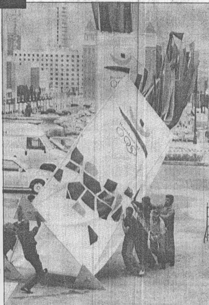
↑巴塞隆納市工人，13 日在奧運新聞中心附近，準備把一幅大型奧運海報豎起。