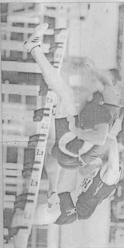
▲美國的韓波福昨在聽奧男子110公尺欄項目中，跑出14秒16成績，打破聽障世界紀錄與大會紀錄。 (鄭任南攝)

經過4年努力，選手們的辛苦終於有了代價，不但為國爭光，口袋還能「麥克、麥克」，一舉兩得！