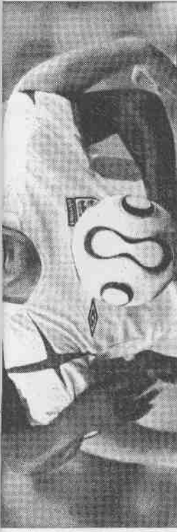
▲英格蘭前鋒魯尼 (前) 受到厄瓜多嚴密防守，沒有起腳射門的機會。