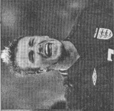
▲貝克漢進球後的笑容(左到右)1998年對哥倫比亞、2002年對阿根廷、昨天對厄瓜多，信心十足，表情不變。