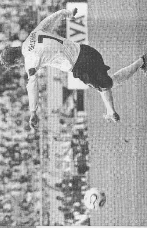
▲英格蘭大將貝克漢在對厄瓜多一役射進致勝的自由球後，興奮地握拳高呼。