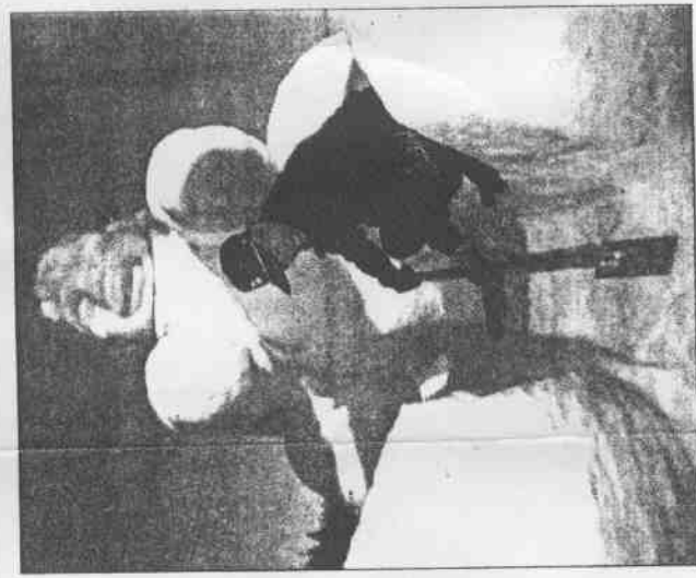
長野冬運雪車競技場旁的一名居民，二日在比賽場地附近雕刻一座雪人。(美聯社)