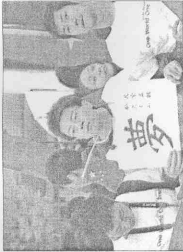
聖火到處 一場惡夢

一名可能前往北京採訪奧運的媒體記者發現在BIMC的網路報名上只能點選「中國台北」之後，只能暫時停止填寫。他希望北京市政府能夠盡快依照一九八九年兩岸奧會的協議更正，否則如果在五月廿日之前無法填寫報名表，恐將失去採訪北京奧運的機會。