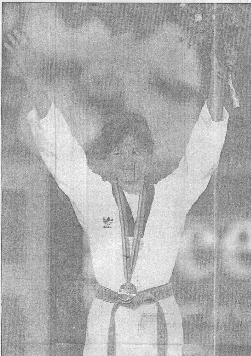
↑羅月英勇奪本屆奧運鱈量級冠軍，領獎後高舉雙手向觀眾致意。