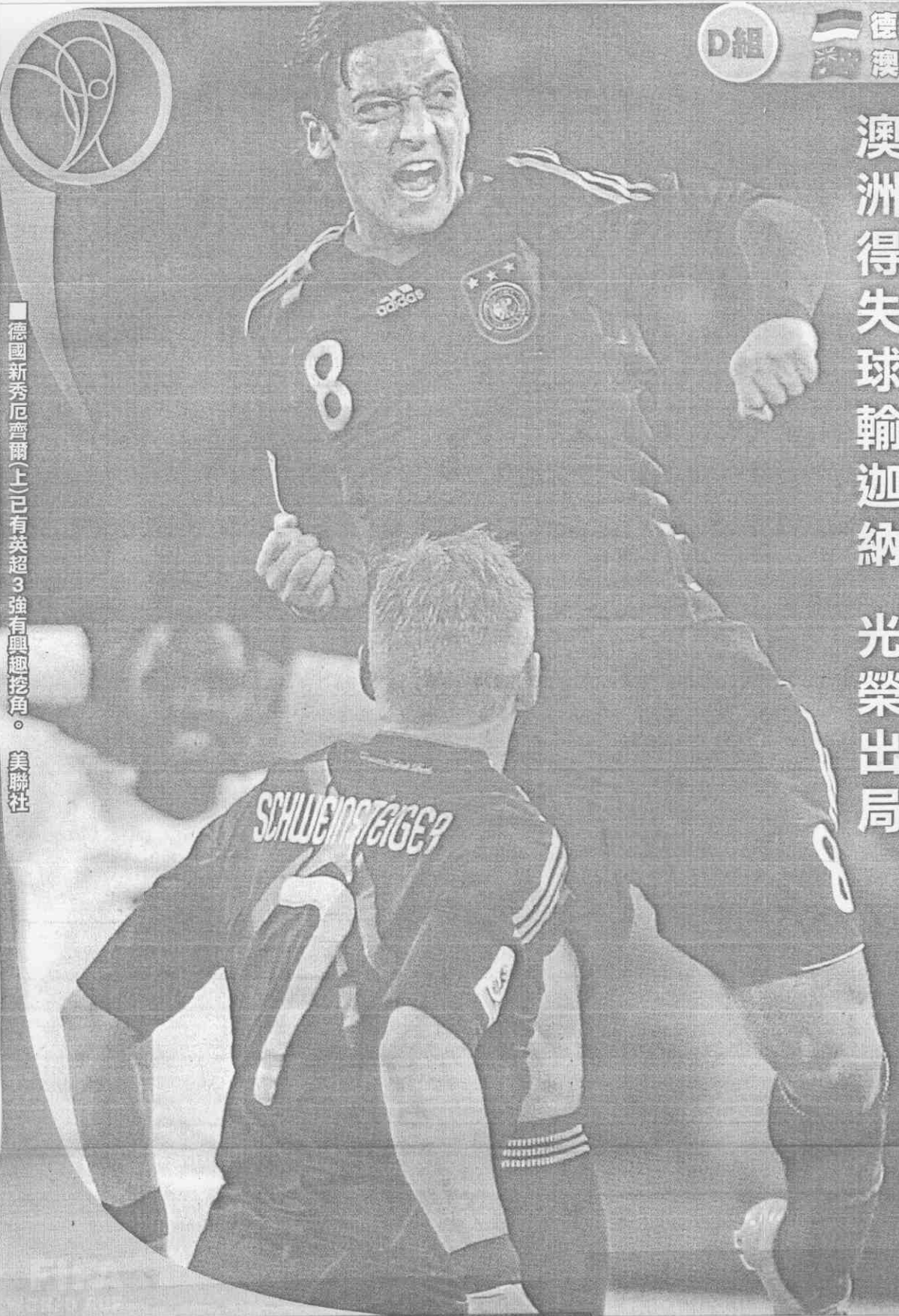
德國新秀厄齊爾(上)已有英超3強有興趣挖角。