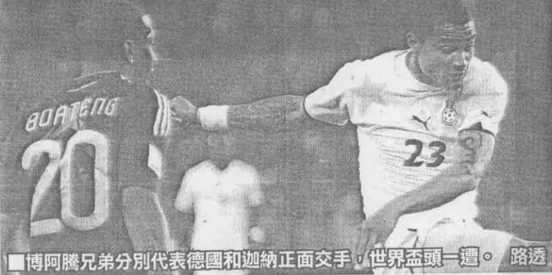
博阿騰兄弟分別代表德國和迦納正面交手，世界盃頭一遭。