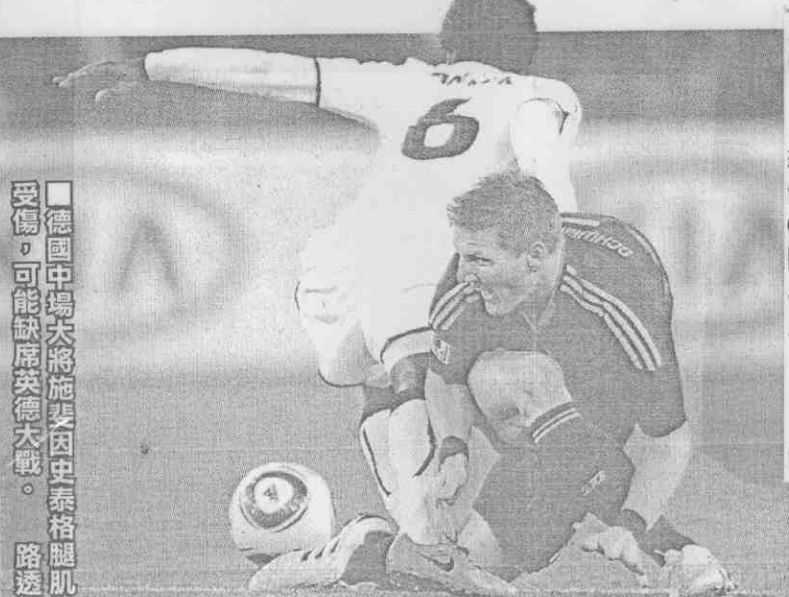
德國中場大將施斐因史泰格腿肌受傷，可能缺席英德大戰。

【王毓健／綜合報導】迦納vs.德國，出現了世界盃賽場，兄弟分別代表不同國家，而且是同場先發開牆。同父異母的博阿騰(Boateng)兄弟，哥哥K.P.博阿騰昨是迦納先發中場，弟弟J.博阿騰則是德國先發左後衛，蔚為奇觀。博阿騰兄弟的父親是迦納人，移民德國後和德國女性生下K.P.博阿騰後離婚，再娶另一名德國女性，才生下J.博阿騰。博阿騰兄弟21歲以前都效力德國各年齡層代