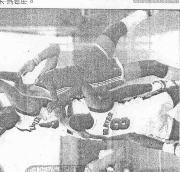
(真傳社聯美) 隊球籃聯蘇 (左) 隊球籃聯美 (右) 隊球籃聯蘇 (左) 隊球籃聯美 (右)

大，接受了近一年的治療，所有費用都由鷹隊負擔，等腳傷好後，卻用來打敗了美國隊。 據悉，沙巴尼斯在之戰出賽，沙巴尼斯也滿口答應，但廿八日還是出場，打了卅五分鐘，許多在場美國記者，都認為沙巴尼斯不講信用。 不要在对美 美國隊昨天的落敗，說得上是以己之矛攻己之盾的結果。 本報特派記者 包勇敏