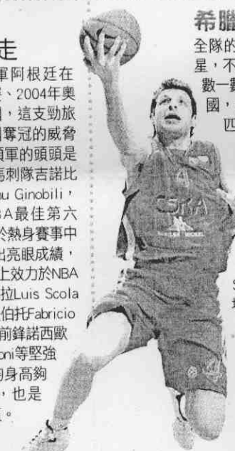
Theodoros Papaloukas

全隊的球員裡沒有一位是來自NBA球壇明星，不過憑著希臘職業籃球聯盟為歐洲國裡數一數二的出名，加上2006年世錦賽擊敗美國，在這次入選球員裡共有五名來自奧林匹亞科斯隊，在6呎7吋大SIZE的控球後衛帕帕盧卡斯Theodoros Papaloukas，以其攻守兼俱的優異領軍下，搭配在世錦賽籃下表現佳、有小歐尼爾之稱的中鋒索佛科利斯-索特森尼迪斯Sofoklis Schortsianitis，及籃板能力強的前鋒佛特西斯Antonis Fotsis、後衛斯潘諾里斯Vasilis Spanoulis等又高又準的優越團體，以全場紮實防守的利器，表現不容小覷。