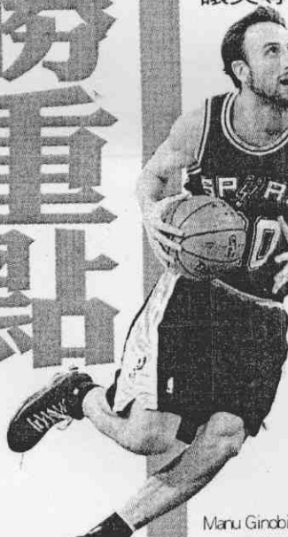
Manu Ginobili

上屆奧運冠軍阿根廷在2002年世錦賽、2004年奧運皆擊敗美國，這支勁旅將是美國奪冠的威脅隊，領軍的頭頭是NBA馬刺隊吉諾比利Manu Ginobili，即NBA最佳第六人，於熱身賽中也打出亮眼成績，再結合隊上效力於NBA火箭隊的史科拉Luis Scola及馬刺隊友奧伯托Fabricio Oberto、公牛前鋒諾西歐尼Andres Nocioni等堅強實力，在平均身高夠高的優勢下，也是熱門搶金隊伍。