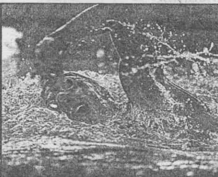
↑史密絲是今年奧運池畔的超級黑馬。